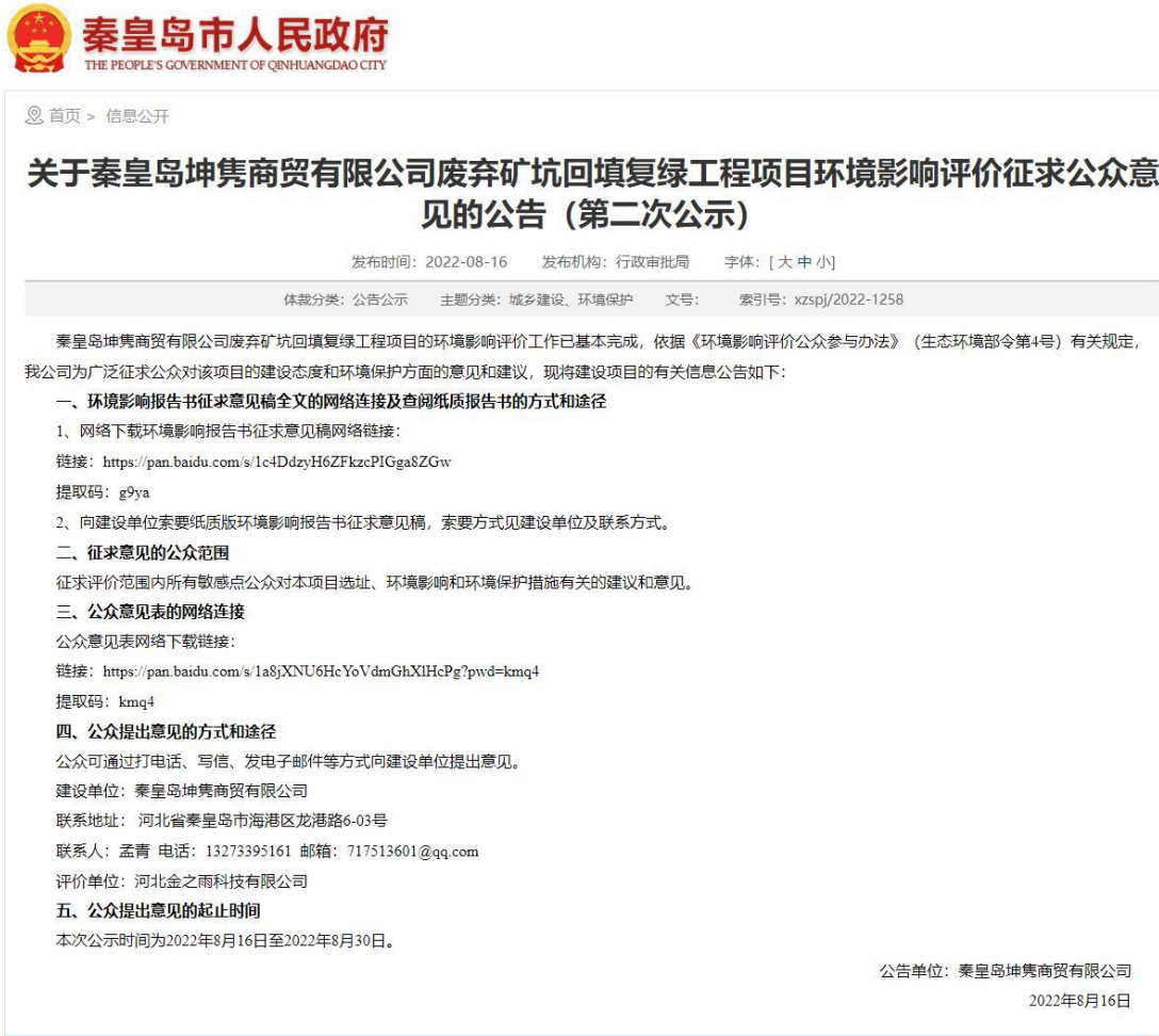
图 2 第二次环评信息公示网络截图