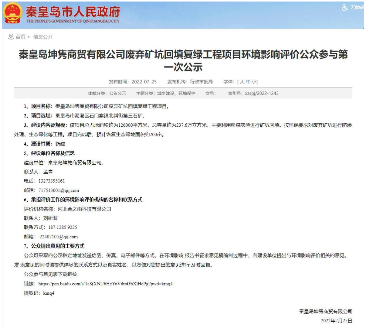
图 1 第一次环评信息公示网络截图